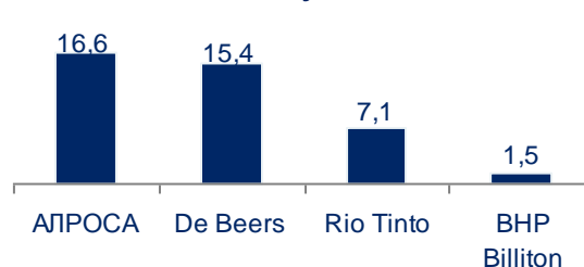
Добыча алмазов основными алмазодобывающими компаниями в I-м полугодии 2010 г., млн. карат